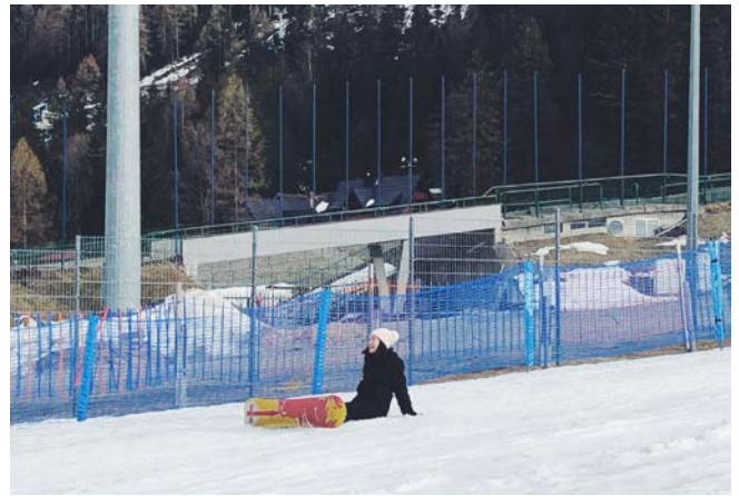
照片說明:滑雪和雪板初體驗