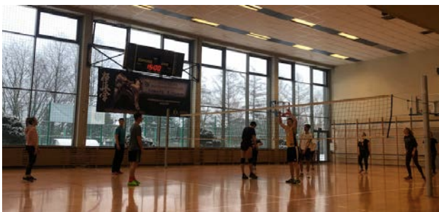
照片說明：ESN（交換學生社團）所舉辦的運動活動