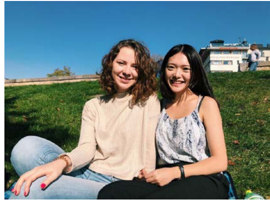
照片說明:晴天時和斯洛伐克室友在瓦維爾河岸 旁的草地上享受日光浴