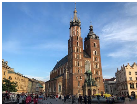
照片說明：克拉科夫舊城廣場