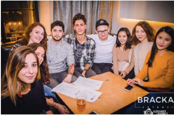
照片說明:ESN 所舉辦的每週語言交換之夜