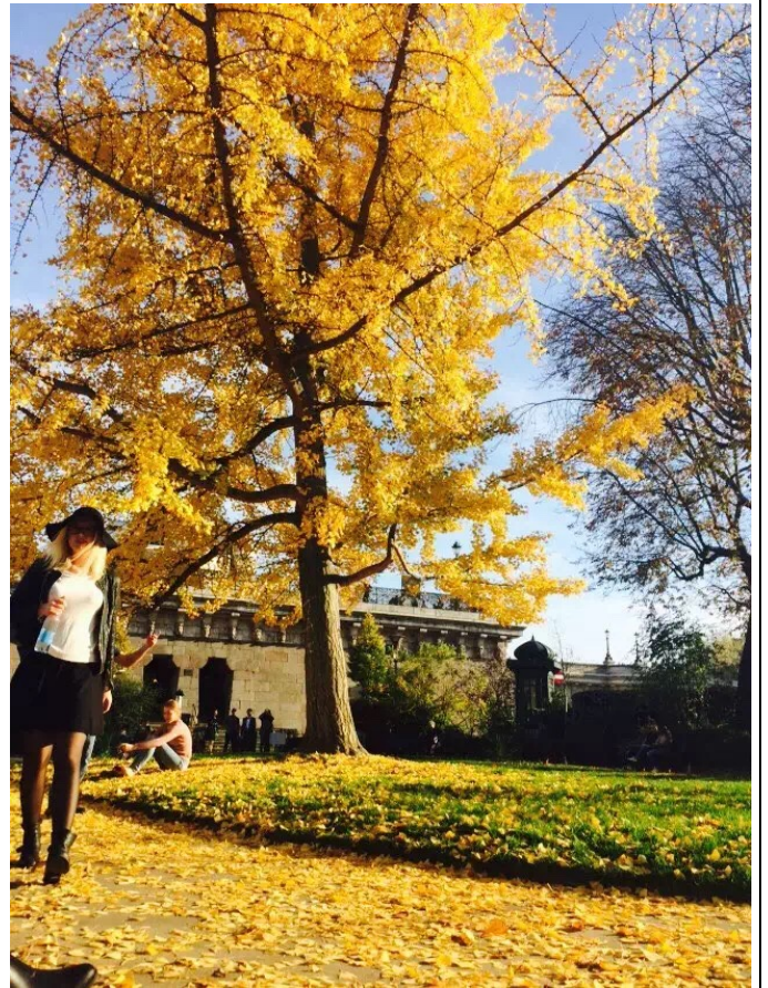
照片說明：巴黎西岱島公園的銀杏樹