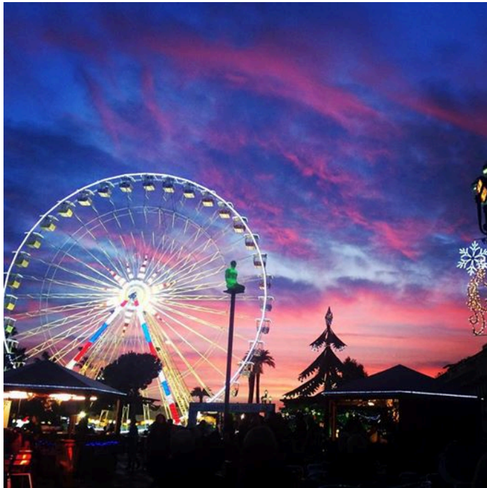
照片說明： 尼斯傍晚時分的聖誕市集