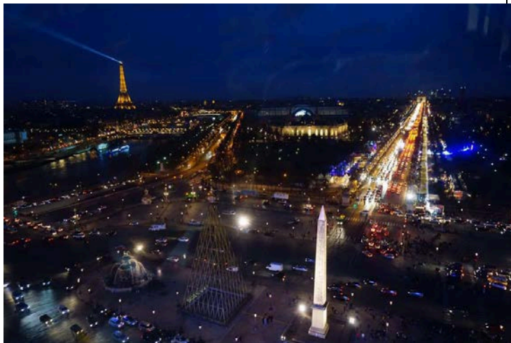
照片說明： 巴黎夜景