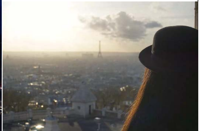
照片說明：在聖心大教堂穹頂俯瞰巴黎