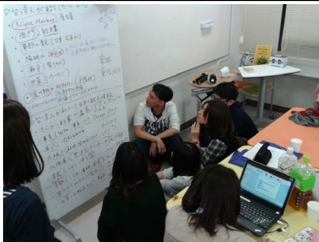
照片說明：我(白衣)與宇都宮大學的同學交流