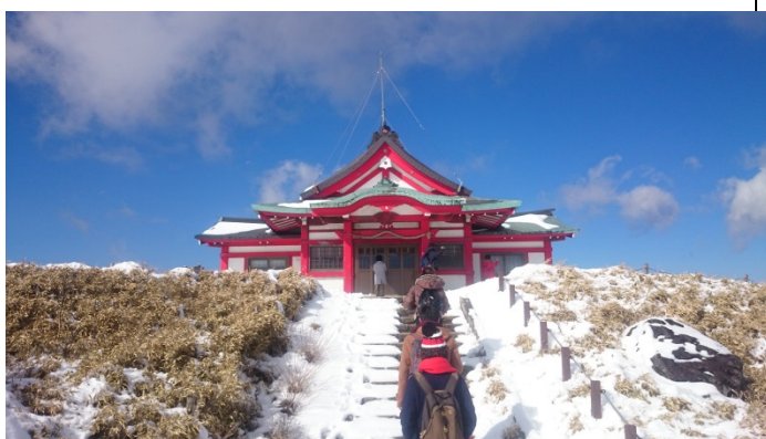
照片說明：駒岳神社