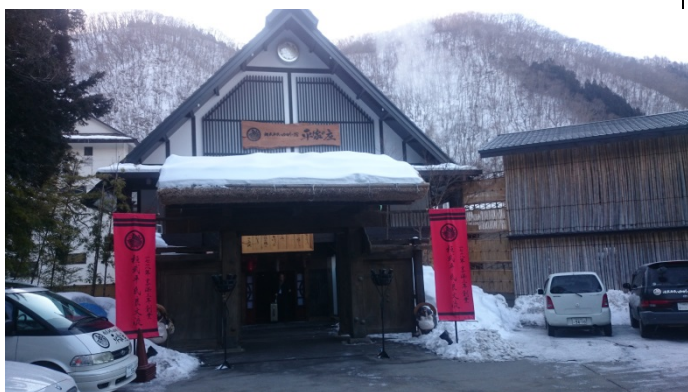
照片說明：平家之庄